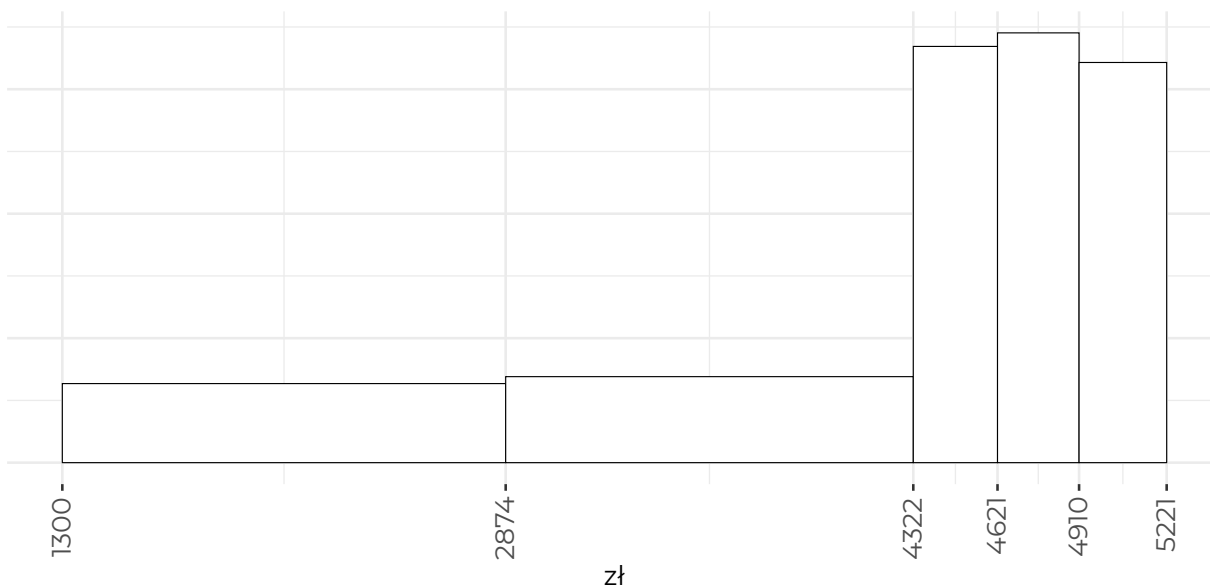
Miesięczne wynagrodzenie brutto z tytułu umowy o pracę po uzyskaniu dyplomu (równoliczne grupy)

Poniższa tabela wyjaśnia informacje przedstawione na wykresie.