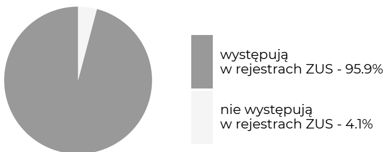
Absolwenci, którzy w okresie objętym badaniem ...