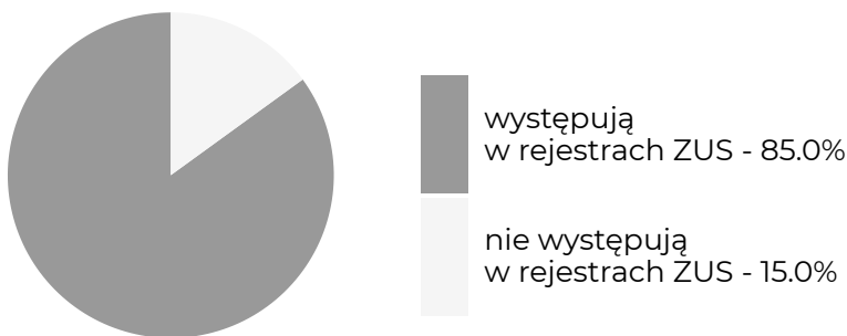
Absolwenci, którzy w okresie objętym badaniem ...