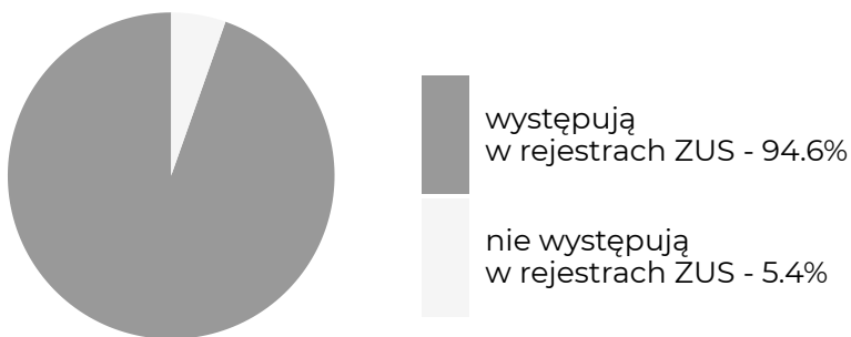
Absolwenci, którzy w okresie objętym badaniem ...